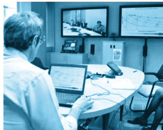
Enregistrement d'une formation à distance

Par ailleurs, une partie des experts et formateurs approchant l'âge de la retraite, le risque est grand de voir leurs savoir-faire et connaissances tomber dans l'oubli après leurs départs. Total a ainsi cherché à se doter d'une solution d'enregistrement pour transmettre le savoir de ses collaborateurs.